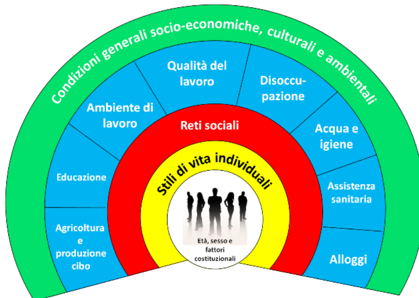
Immagine tratta da Dahlgren G. e Whitehead M. (1991) 1

Tra i Determinanti di salute modificabili , gli stili di vita individuali sono quelli su cui le persone hanno maggiore potere di cambiamento e che rivestono un ruolo fondamentale nella genesi delle principali Malattie Croniche Non Trasmissibili (MCNT) - come cardiopatie, ictus, tumori, disturbi respiratori cronici, diabete, etc.- che sono responsabili di una percentuale molto importante di decessi, morti premature e disabilità.